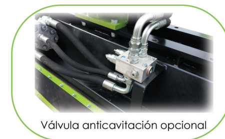
Válvula anticavitación opcional