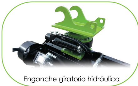
Enganche giratorio hidráulico